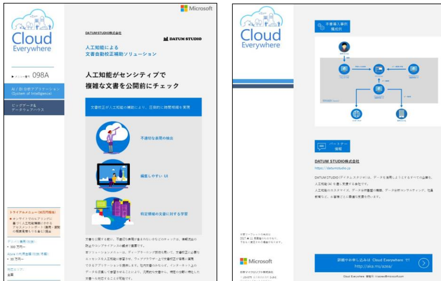
※ Microsoft Cloud Everywhere サイトの本ツール ページイメージ

《Microsoft Cloud Everywhere メニュー番号 098A》 (WEB) http://aka.ms/azea/